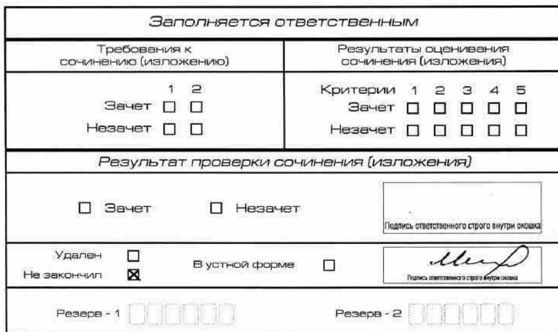
Рис. 12. Заполнение полей нижней части бланка регистрации (завершение написания сочинения (изложения) по уважительным причинам)

о досрочном завершении написания итогового сочинения (изложения) по уважительным причинам» (форма ИС-08), вносят соответствующую отметку в форму ИС-05 «Ведомость проведения итогового сочинения (изложения) в учебном кабинете ОО (месте проведения)» (участник итогового сочинения (изложения) должен поставить свою подпись в указанной форме). В бланке регистрации указанного участника итогового сочинения (изложения) необходимо внести отметку «X» в поле «Не закончил» для учета при организации проверки, а также для последующего допуска указанных участников к повторной сдаче итогового сочинения (изложения) в дополнительные сроки. Внесение отметки в поле «Не закончил» подтверждается подписью члена комиссии по проведению итогового сочинения (изложения) (см. рис. 12).